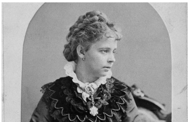
อลิซ มอร์ส เอิร์ล (Alice Morse Earle)

“ แม้ไม่ใช่ทุก ๆ วัน ที่นับได้ว่าเป็นวันที่ดี ... แต่ ย่อมมีเรื่องที่ดี เกิดขึ้นในทุก ๆ วัน ”